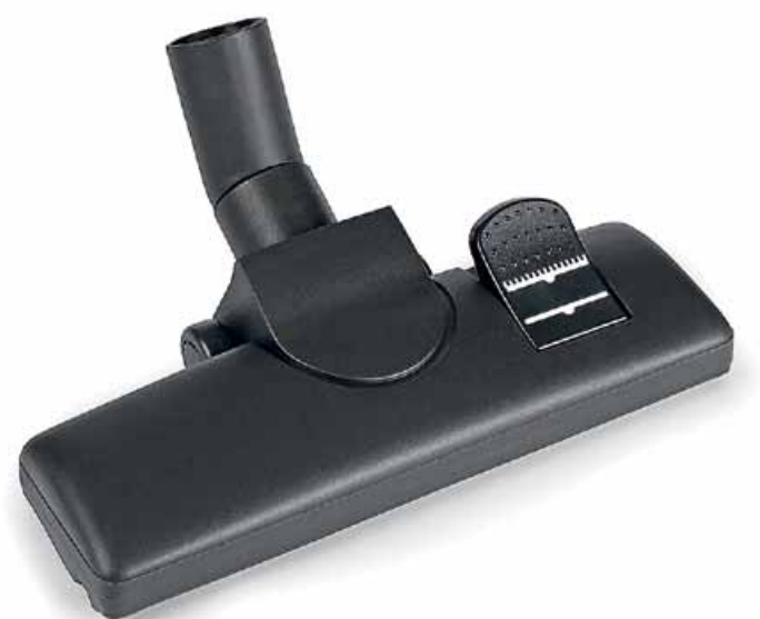
Комбинированная насадка для пола STIHL